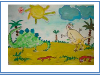
«Ера динозаврів» (акварель, гуаш, фломастери)