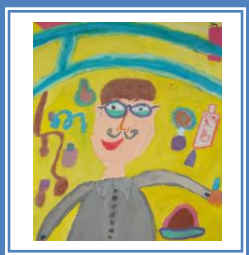
«Не зупиняйтесь на досягнутому» (гуаш)