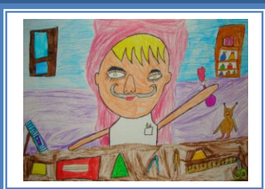
«Наука повинна йти вперед» (кольорові олівці, фломастери)