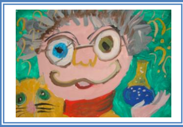
«Божевільний вчений» (гуаш)