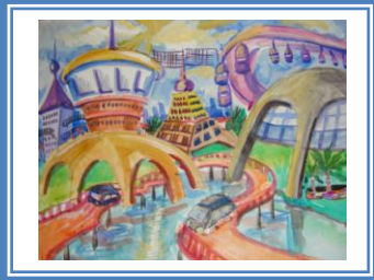
«Майбутнє місто – екологічно безпечне» (акварель)