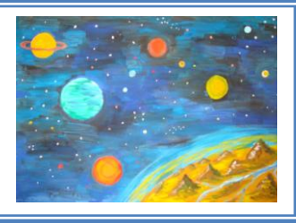
«Далекий Всесвіт» (гуаш)