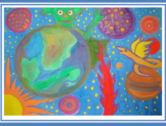
«Паралельний світ» (гуаш)