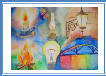
«Світло – це життя» (акварель)