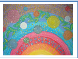
«Наукові світи» (гуаш)