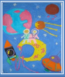
«Мир і дружба між планетами» (гуаш)