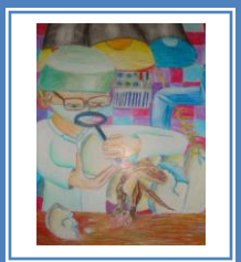
«Інкубатор для динозавриків» (кольорові олівці)