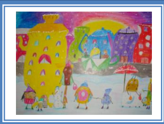
«Солодке королівство» (кольорові олівці)