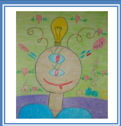
«Нові ідеї вченого» (кольорові олівці, фломастери)