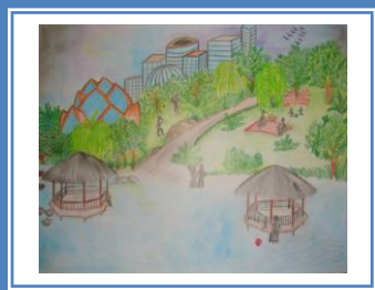
«Спортивний комплекс в Дніпропетровську» (кольорові олівці)