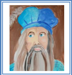
«Леонардо да Вінчі» (гуаш)