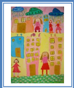
«Місто моєї мрії» (гуаш)