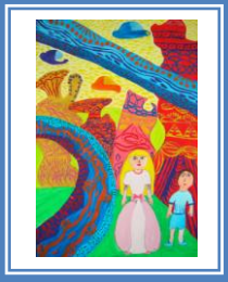
«Ми потрапили у місто майбутнього» (гуаш)